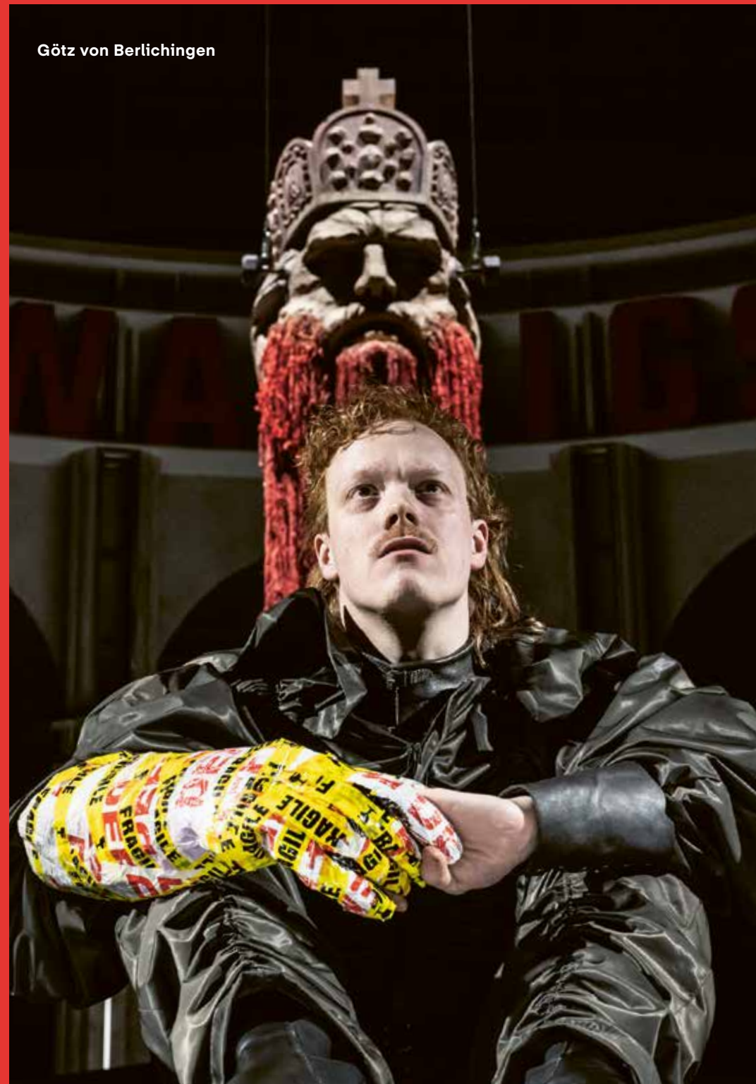
Götz von Berlichingen