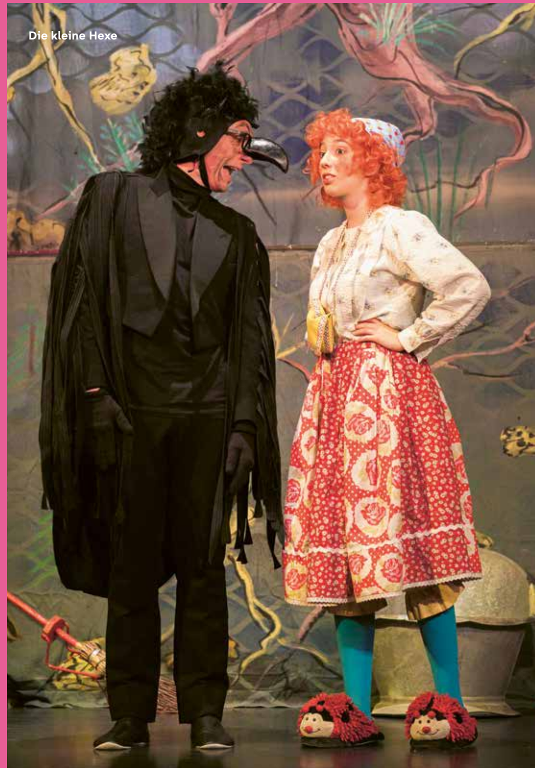
Die kleine Hexe